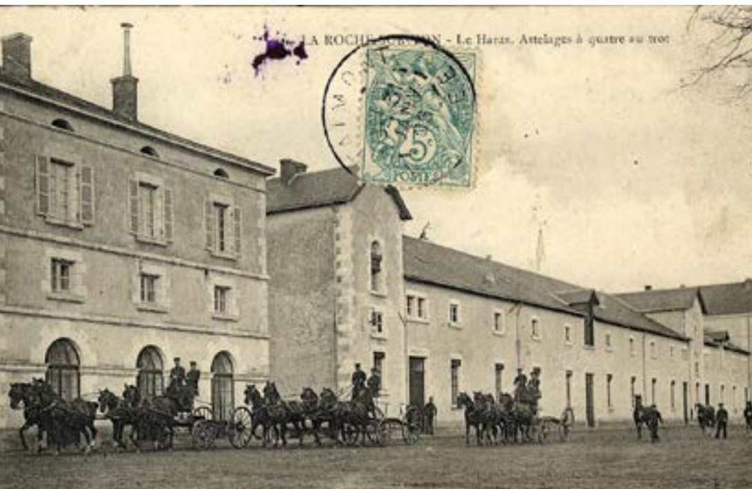
Haras des années 1900