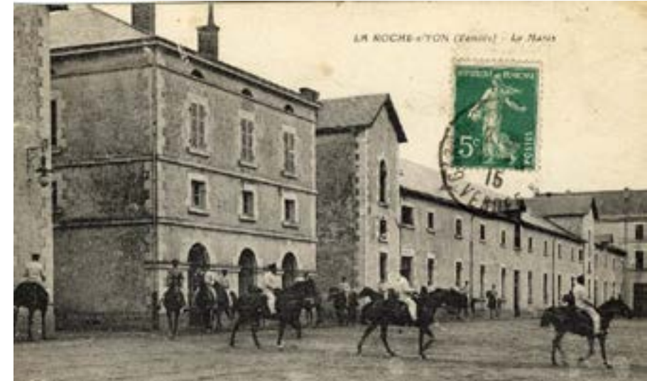
Cour d'honneur année 1900

Certains haras ont conservé leur fonction de lieu d'entretien d'étalons et/ou de reproduction et d'autres se sont transformés en lieux culturels et/ou touristiques.