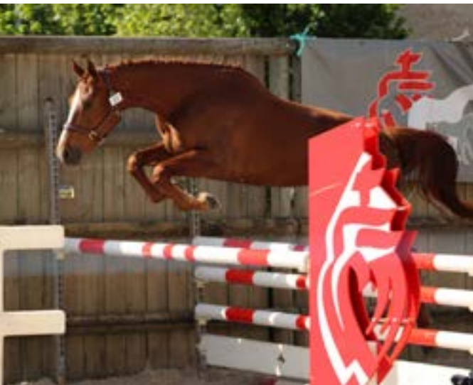
Présentation jeune cheval (Trophée du Foa)