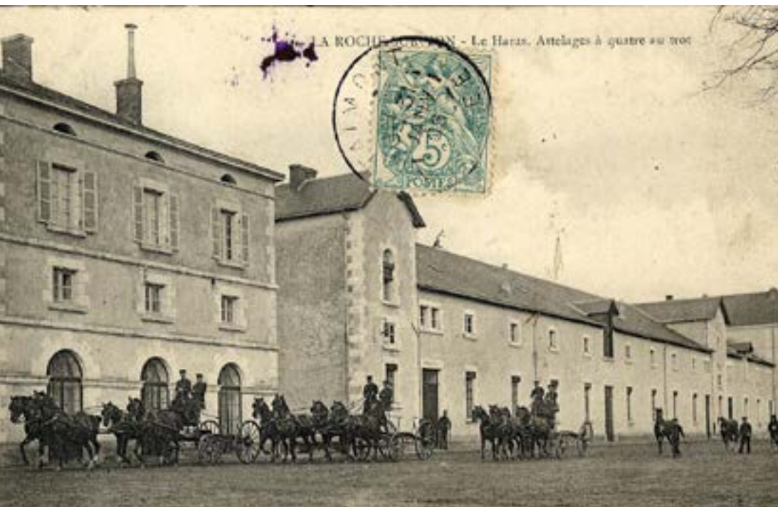
Haras des années 1900