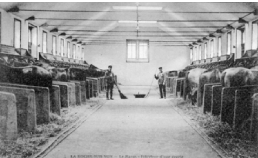
Écurie n°5 année 1900