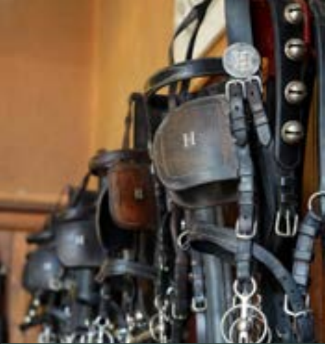
Harnachement de la Sellerie d'Honneur