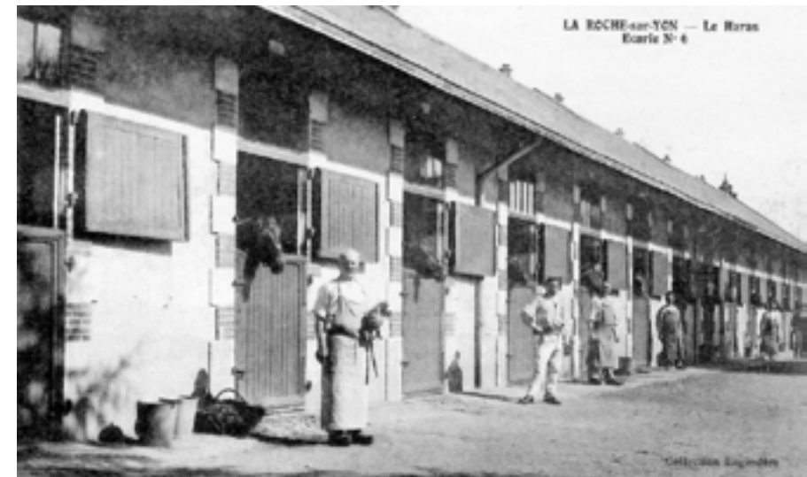
Écurie n°6 année 1900