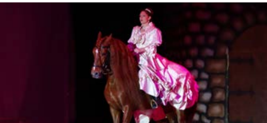
Spectacle au Haras de la Vendée

Il possède également l'un des derniers ateliers traditionnels de sellerie encore actif en France et y propose un CAP sellier-harnacheur en partenariat avec l'école des Établières.