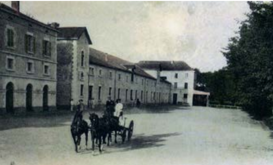
Cour d'honneur année 1900

Le Haras possédait un atelier de sellerie-bourrellerie qui réparait toutes les selles et harnachements du Haras.