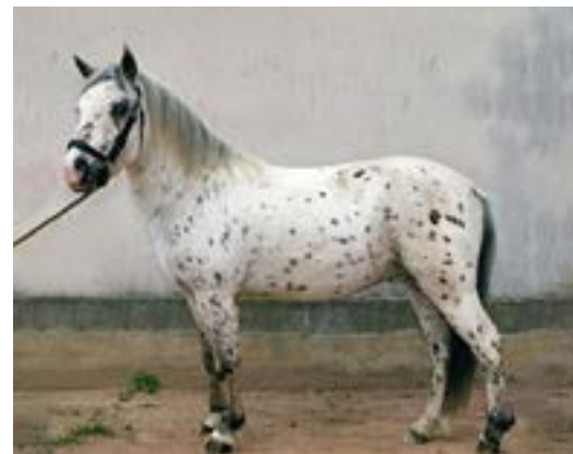
Poney Français de Selle