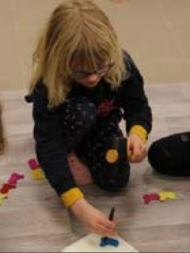
Activités pour les scolaires