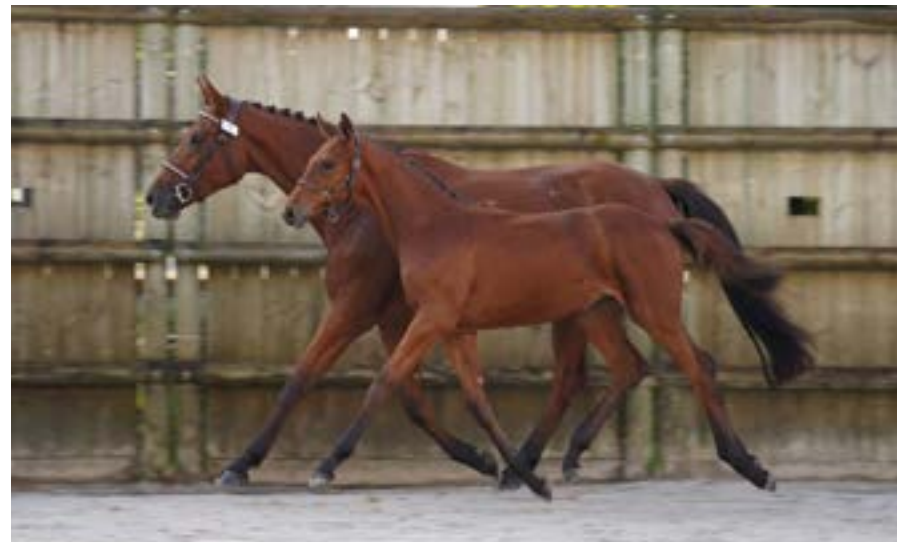
Présentation de poulain (Trophée du Foa)