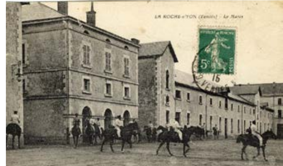
Cour d'honneur année 1900

Certains haras ont conservé leur fonction de lieu d'entretien d'étalons et/ou de reproduction et d'autres se sont transformés en lieux culturels et/ou touristiques.