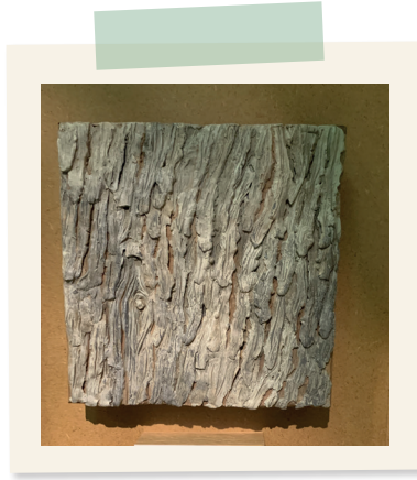
Écorce de conifères

3) En réalisant le puzzle des différentes formes de feuilles des arbres :