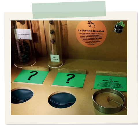
Boîtes tactiles et à odeur de fruits (conifères)