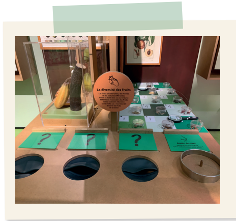
Boîtes tactiles et à odeur de fruits (feuillus)

4) En touchant et en sentant différents fruits d'arbres :