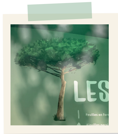
Silhouette de conifères