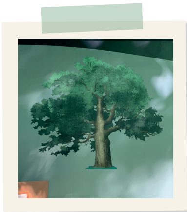
Silhouette de feuillus

1) En observant les différentes silhouettes des arbres :