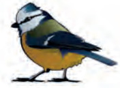
la mésange bleue