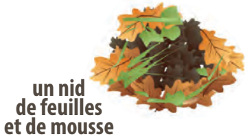
un nid de feuilles et de mousse