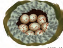
un nid de duvet