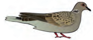
la tourterelle des bois