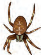
l'araignée épeire diadème