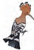
la huppe fasciée