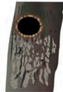
des trous autour d'une loge