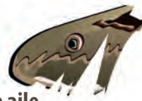
une aile de papillon