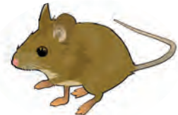
le mulot sylvestre