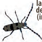
la rosalie des Alpes (insecte)