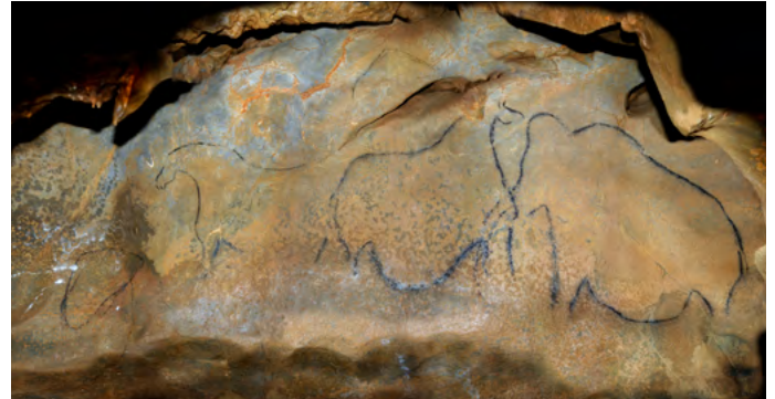
Dans la région, les grottes de Saulges (53) offrent un magnifique exemple d'art pariétal.

Si aucun témoignage écrit n'existe pour ces périodes anciennes, les hommes de la fin du Paléolithique ont laissé de nombreuses œuvres d'art. Les plus célèbres sont les grottes ornées qui montrent des animaux sauvages et représentent plus rarement des hommes et des femmes (art pariétal*).