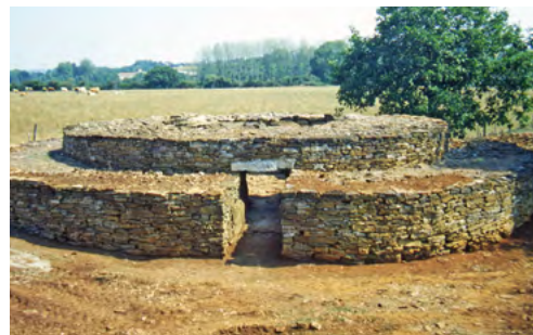
Dolmen et tumulus des Cous, en Vendée