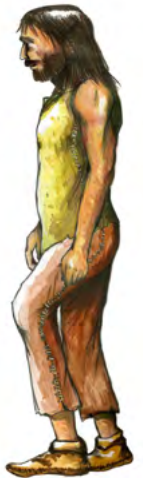
Homme du Néolithique

Il se sédentarise* alors dans des villages et fabrique des maisons en terre, en pierre et en bois. La terre et le bois étant des matériaux périssables, les archéologues ne retrouvent aujourd'hui la plupart du temps que les trous de poteaux creusés dans le sol.