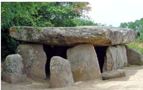
Dolmen de la Frébouchère, en Vendée

L'art se perpétue à travers les parures. Grâce à certaines découvertes, on imagine que les menhirs pouvaient être peints. En Bretagne, certains présentent des dessins gravés.