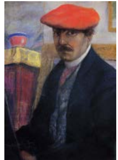
Charles Milcendeau, Autoportrait Huile sur toile - 1917 Collection Musée Charles Milcendeau

Au début de sa carrière, il est considéré par ses amis comme un excellent portraitiste. Puis, petit à petit, en découvrant le pastel il se met à dessiner des personnages dans des intérieurs. Ce n'est que vers la fin de sa vie qu'il s'intéresse au paysage.