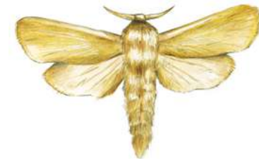
Papillons diurnes et nocturnes