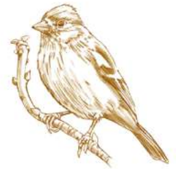
Pinson des arbres