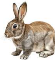
Lapin de garenne