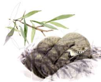
Couleuvre à collier