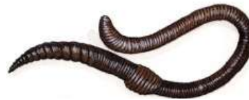
Ver de terre ou lombric