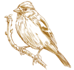
Pinson des arbres