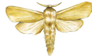
Papillons diurnes et nocturnes