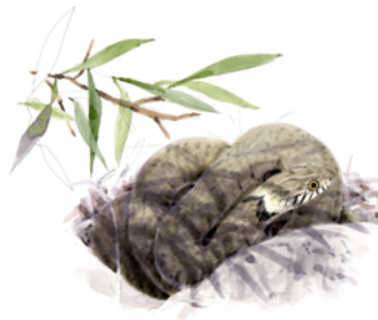
Couleuvre à collier