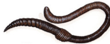
Ver de terre ou lombric