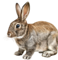
Lapin de garenne