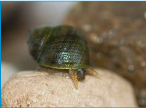
LE BIGORNEAU le bigorneau le bigorneau