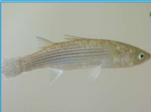
LE MULET le mulet le mulet