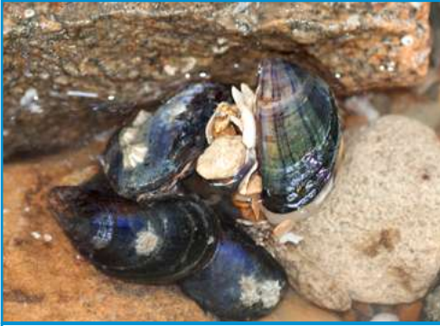
LA MOULE la moule la moule