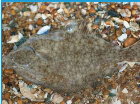
LA PLIE la plie le plie