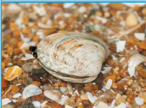
LA PALOURDE la palourde la palourde