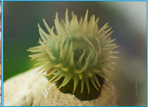
L'ANÉMONE l'anémone l'anémone