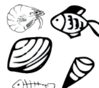
ANIMAUX MORTS OU VIVANTS