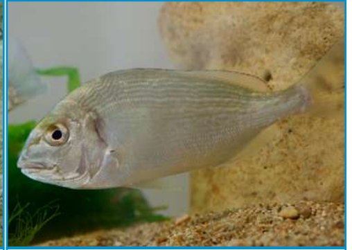
LA DORADE la dorade la dorade