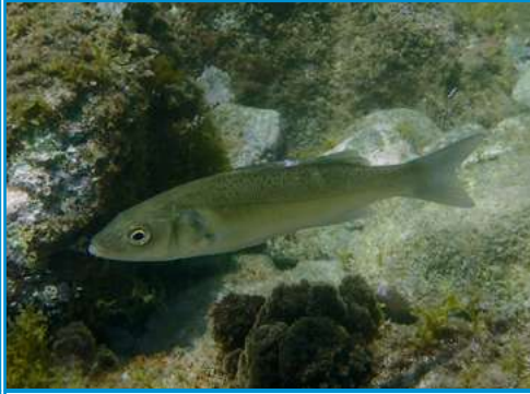
LE BAR le bar le bar