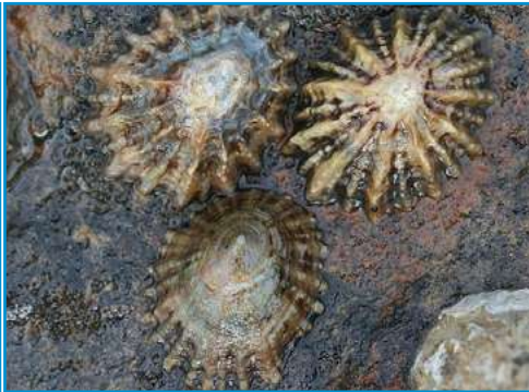
LA PATELLE OU BERNIQUE la patelle ou bernique la patelle ou bernique