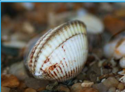
LA COQUE la coque la coque