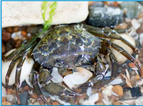
LE CRABE VERT le crabe vert le crabe vert