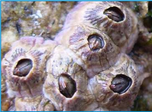
LA BALANE la balane la balane