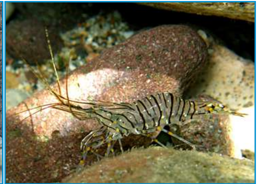
LA CREVETTE la crevette la crevette