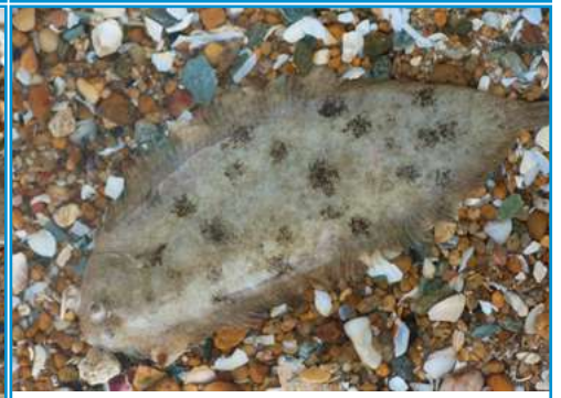
LA SOLE la sole la sole