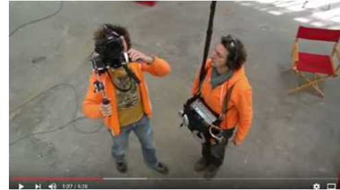
La Plongée / Contre Plongée: Les Leçons de Cinéma, 5m28