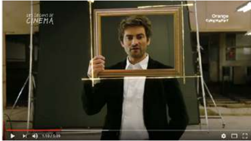
Le Cadrage : Les Leçons de Cinéma, 5m09