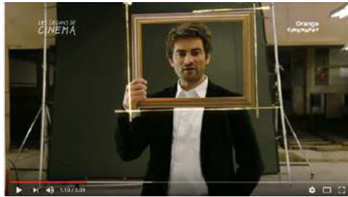
Le Cadrage : Les Leçons de Cinéma, 5m09