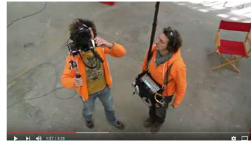
La Plongée / Contre Plongée: Les Leçons de Cinéma, 5m28