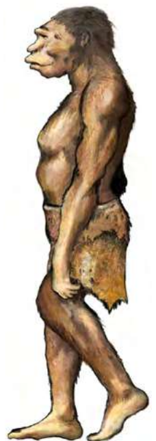
Homme du Paléolithique

Les tribus déplacent régulièrement leur campement pour suivre les troupeaux. On dit qu' elles sont nomades* . Leurs tentes sont faites de peaux d'animaux et d'éléments naturels comme des branchages. Grâce à l'archéologie nous savons que ces hommes vivaient également dans des abris sous roche ou à l'entrée des grottes.