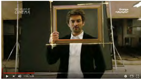
Le Cadrage : Les Leçons de Cinéma, 5m09