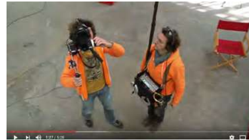
La Plongée / Contre Plongée: Les Leçons de Cinéma, 5m28