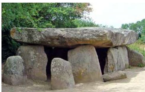
Dolmen de la Frébouchère, en Vendée

L'art se perpétue à travers les parures. Grâce à certaines découvertes, on imagine que les menhirs pouvaient être peints. En Bretagne, certains présentent des dessins gravés.