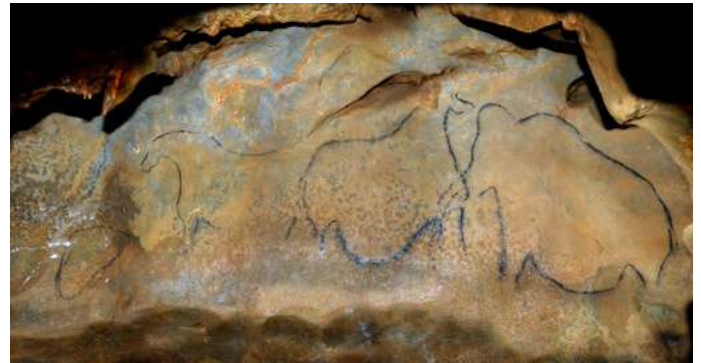
Dans la région, les grottes de Saulges (53) offrent un magnifique exemple d'art pariétal.

Si aucun témoignage écrit n'existe pour ces périodes anciennes, les hommes de la fin du Paléolithique ont laissé de nombreuses œuvres d'art. Les plus célèbres sont les grottes ornées qui montrent des animaux sauvages et représentent plus rarement des hommes et des femmes (art pariétal*).