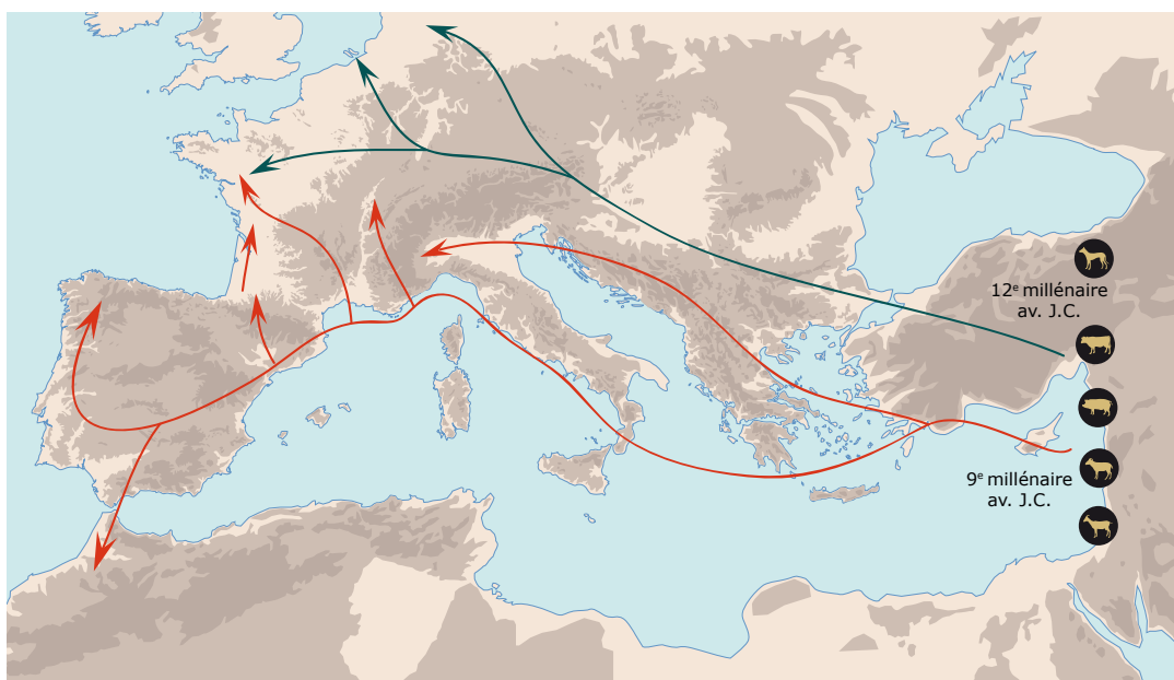
Les deux principales voies de diffusion de l'agriculture.

Depuis le Proche-Orient, ce courant néolithique va atteindre l'Europe par deux voies de communication : le long du Danube et des côtes de la Méditerranée. Il arrive dans l'ouest de la France il y a 7 500 ans.