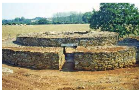
Dolmen et tumulus des Cous, en Vendée