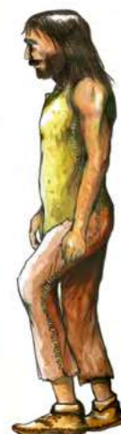
Homme du Néolithique

Il se sédentarise* alors dans des villages et fabrique des maisons en terre, en pierre et en bois. La terre et le bois étant des matériaux périssables, les archéologues ne retrouvent aujourd'hui la plupart du temps que les trous de poteaux creusés dans le sol.