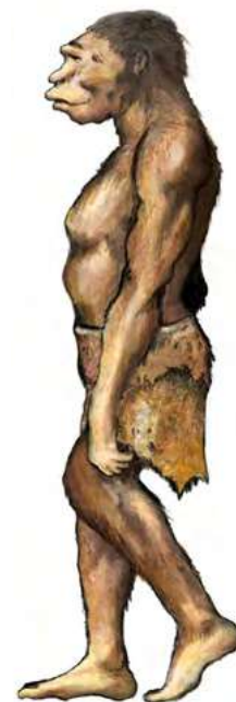
Homme du Paléolithique

Les tribus déplacent régulièrement leur campement pour suivre les troupeaux. On dit qu' elles sont nomades* . Leurs tentes sont faites de peaux d'animaux et d'éléments naturels comme des branchages. Grâce à l'archéologie nous savons que ces hommes vivaient également dans des abris sous roche ou à l'entrée des grottes.