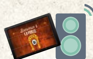
Tablette + enceinte