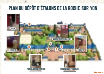
Plan X 2