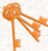
Trousseau de clés