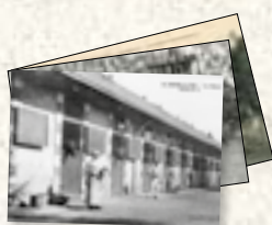
Album de cartes postales