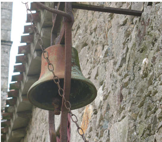
La cloche pour signaler un évènement.