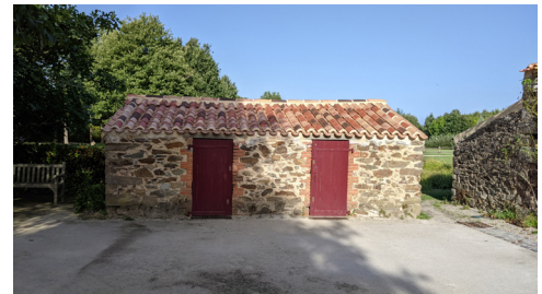
Le toit à cochons.