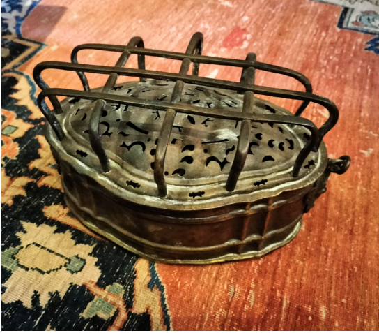
La chaufferette pour se chauffer les pieds.