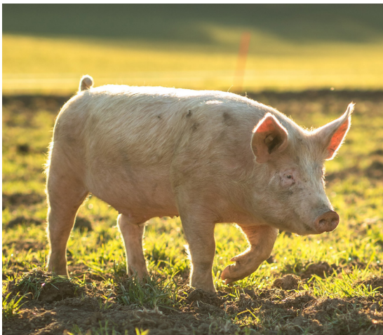
Le pelage du cochon.