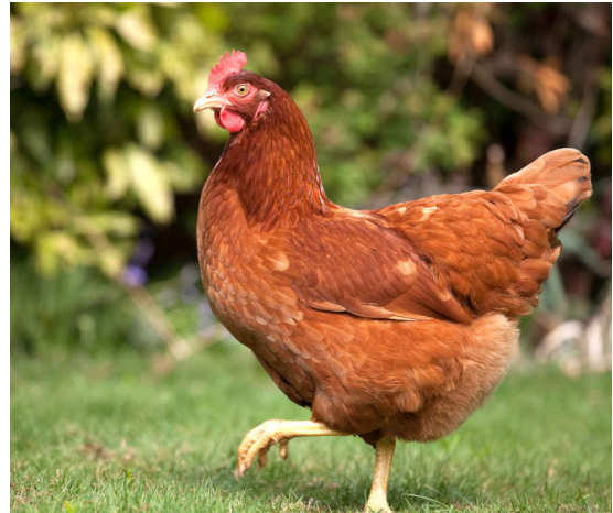
Les plumes de la poule.