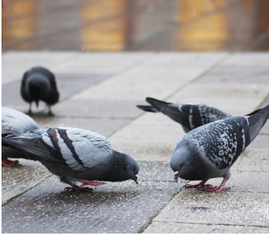
Les pigeons dans le pigeonnier.