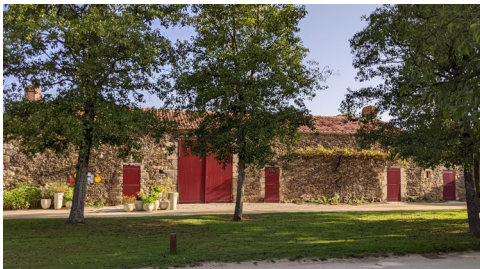
La grange étable, où vivent les vaches l'hiver.