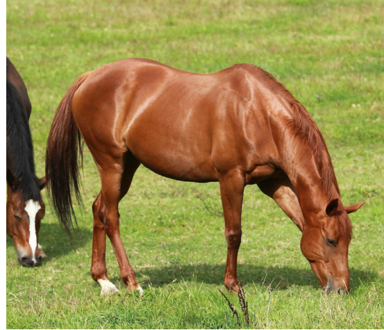
Les chevaux dans l'écurie.