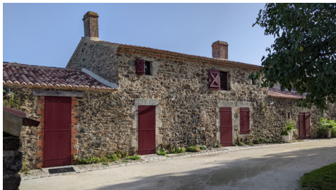
La maison des fermiers.