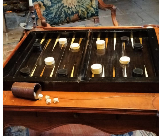
Le tric-trac pour jouer. Ce jeu de société se joue à 2 avec les pions noirs et blancs et les dés.