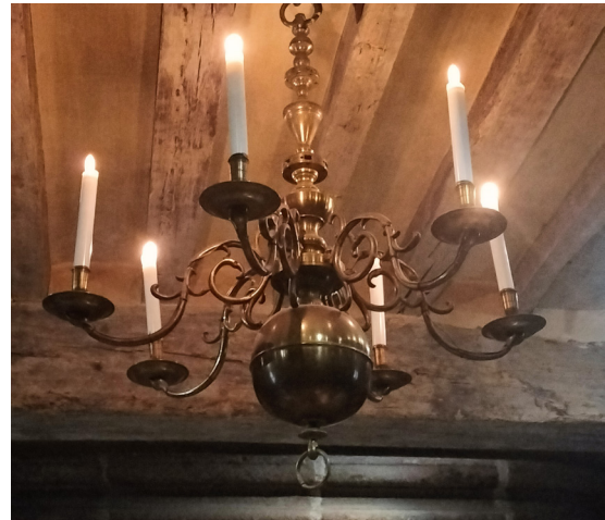
Le lustre pour s'éclairer. Les bougies sont allumées par les domestiques.