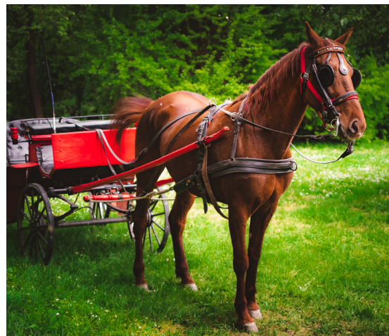
La calèche tirée par des chevaux.