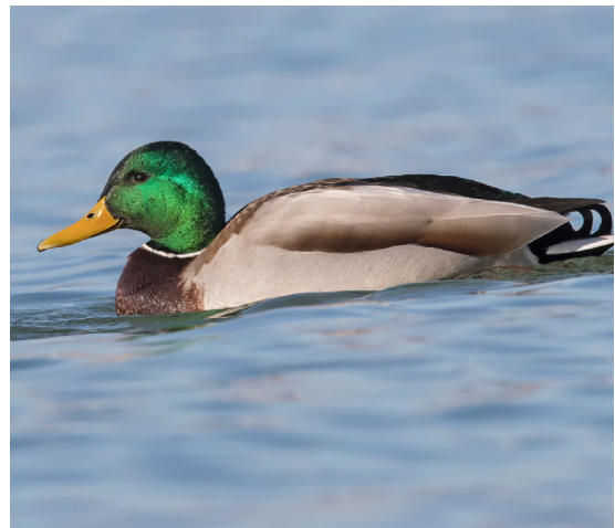
Les plumes du canard.