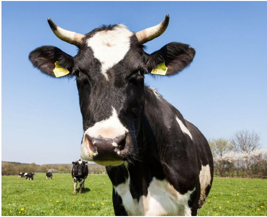
Le pelage de la vache.