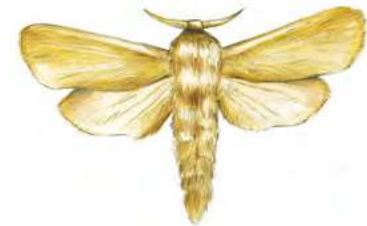
Papillons diurnes et nocturnes