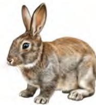
Lapin de garenne