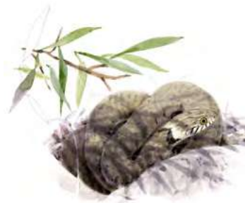
Couleuvre à collier