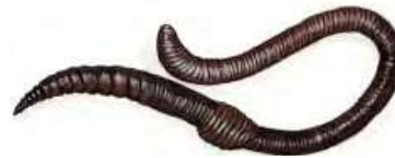
Ver de terre ou lombric