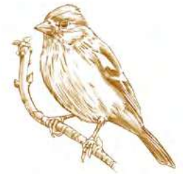
Pinson des arbres