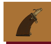
Poire à poudre