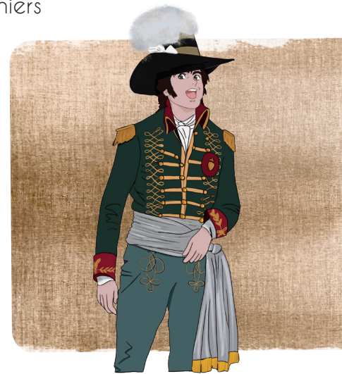
Charette, c'est lui !

Vous disposez de 45 minutes pour découvrir les 9 tableaux réalisés par l'artiste Gilles SCHEID, racontant les derniers instants avant l'arrestation du général Charette. Ces tableaux sont numérotés de 1 à 9. Pour chacun, vous trouverez un commentaire à lire à vos élèves pour expliquer la scène observée.