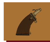
Poire à poudre