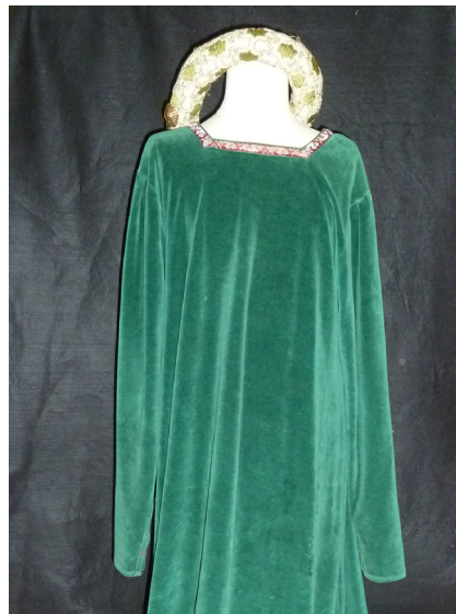
La dame 1 robe longue 1 chapeau rond