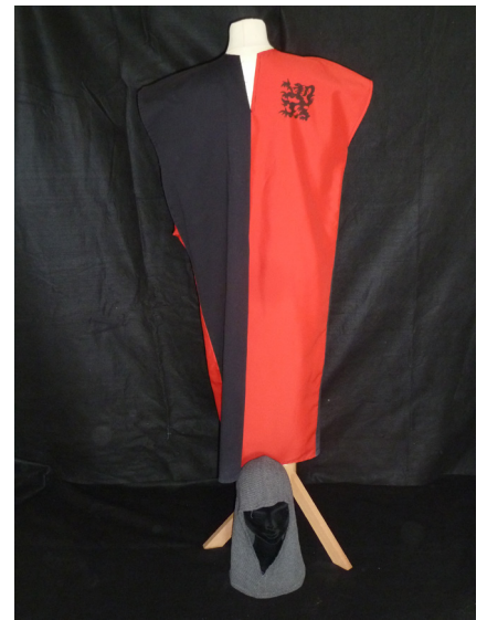
Le chevalier 1 tunique grise et rouge 1 cagoule