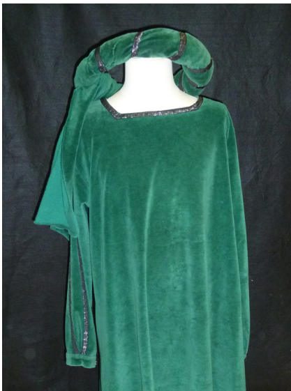
Le seigneur 1 chapeau rond 1 tunique